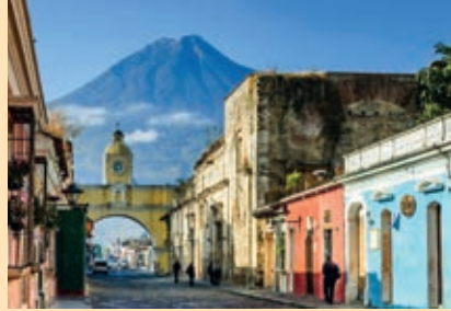
Santiago de los Caballeros.

Nació el 3 de enero de 1715 y fue bautizado en la parroquia del Sagrario de Santiago de Guatemala el día 8. Sus padres fueron Don José Bernardo de Mencos y Coronado y