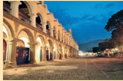
Palacio del Ayuntamiento de Santiago de los Caballeros.