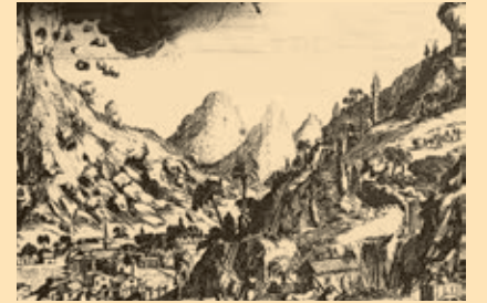
Erupción y terremotos del día de San Miguel.

grandes seísmos. En el año 1773 y siendo Coronel de las tropas de Guatemala Don Melchor de Mencos una serie de fuertes seísmos arrasaron por tercera vez en el siglo la ciudad de Santiago de los Caballeros de Guatemala. Durante los dos siguientes años la población de la ciudad solicitó al gobernador que la capital fuera trasladada a una nueva ubicación más segura. En 1776, la capital fue trasladada a la ciudad de Nueva Guatemala de la Asunción. Actualmente Santiago de los Caballeros se conoce como Antigua de Guatemala.