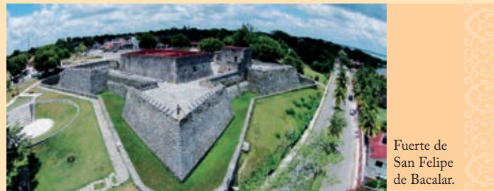
Fuerte de San Felipe de Bacalar.

En 1749 se le comisiona para la captura de maleantes que merodean en la jurisdicción de Escuintla y Guazacapán. En 1753, se le concedió el empleo de Sargento Mayor de las milicias de Santiago de Guatemala por vacante de Don Manuel de Estrada.