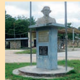
Busto en la ciudad de Melchor de Mencos.

Como ha quedado dicho, se produjeron en 1717 los terremotos de San Miguel siendo Alcalde de Guatemala Don José Bernardo, padre de Don Melchor. Probablemente, estos terremotos fueron provocados por la entrada en actividad de volcanes cercanos a la capital. Se produjo un primer terremoto el día 29 de septiembre (día de San Miguel Arcángel) de 7,4 en la escala de Richter seguido de varias réplicas, produciendo daños considerables. Hubo un abandono parcial de la ciudad, escasez de alimentos, falta de mano de obra y muchos daños en las construcciones de la ciudad, además de numerosos muertos y heridos. José Bernardo, como alcalde, escribió al Presidente de la Audiencia de Guatemala, proponiendo que se trasladara