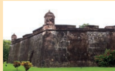
Castillo de Omoa.

quedó en la guarnición de la costa donde le correspondió participar en distintas acciones contras los indios e ingleses hasta el mes de julio de 1782. Participó