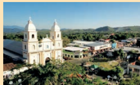
San Vicente, el Salvador.

se le añadirían la provincia de San Miguel -que cubría la zona oriental salvadoreña-, y la provincia de Jérez de la Choluteca -conformada por el territorio de los actuales departamentos hondureños de Valle y Choluteca. Testó en la Nueva Guatemala el 28 de junio de 1779 ante el escribano Don José Sánchez de León. Falleció el 19 de noviembre de 1787.