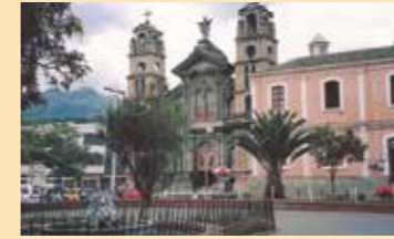
Corregimiento de Otavalo.

La rentabilidad de Otavalo era de las más altas de todos los corregimientos, alternando con el de Tungurahua en el primer puesto entre los distritos contribuyentes del tesoro Real.