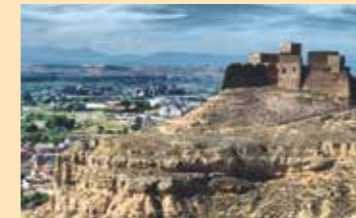
Castillo de Monzón.