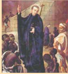
San Pedro Claver.

La señora después de una próspera navegación de vuelta a la península, enfermó gravemente y a los pocos días falleció.