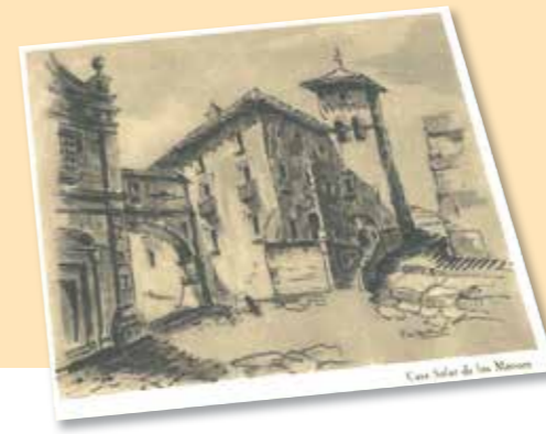
Casa Solar de los Mencos