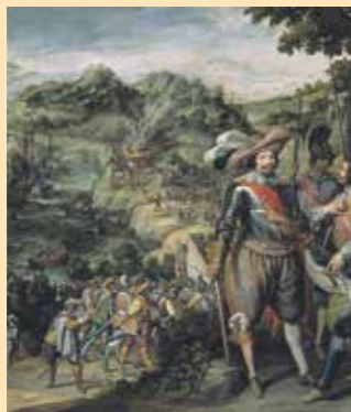
Recuperación de la Isla de San Cristóbal.